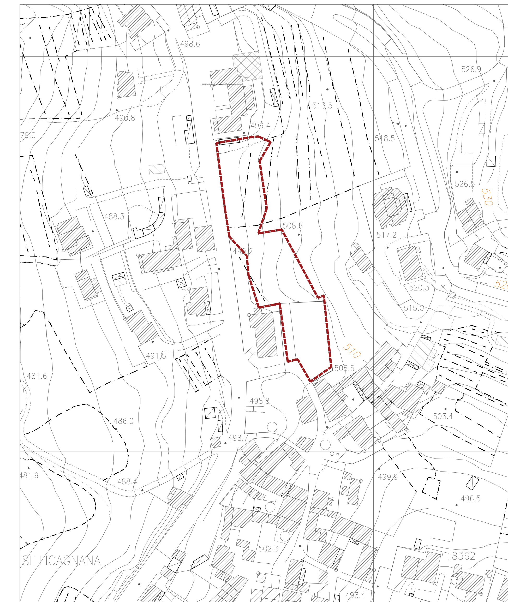
INDIVIDUAZIONE DELL'AREA DI INTERVENTO scala 1:1000