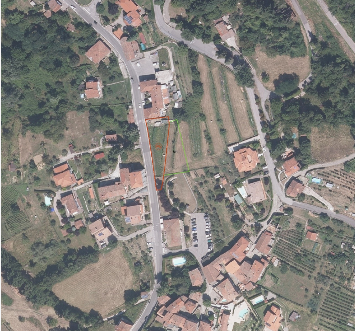
Originale in scala 1:2.000